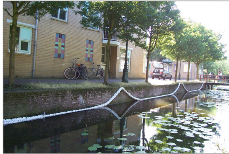
Kattenklimtouw aan de Blekerskade, Leiden